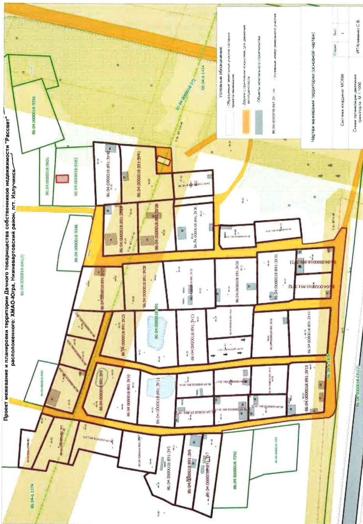
Проект межевания и планировки территории Дачного товарищества собственников недвижимости "Рассвет" расположенного ХМАО-Югра, Нижнеуртовский район, пгт. Излучинск